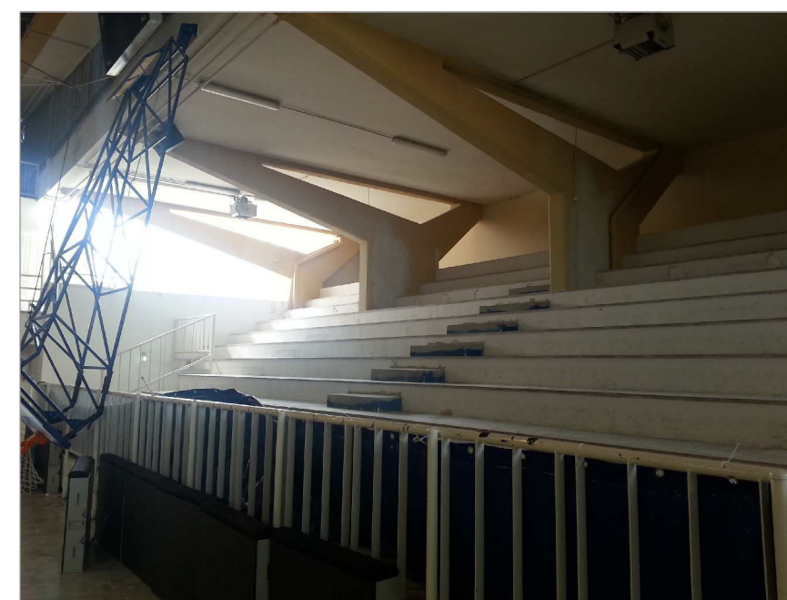
Particolare struttura pilastro-trave della copertura